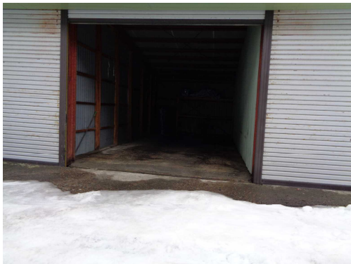
豊町車庫（大館市豊町18-3地内）